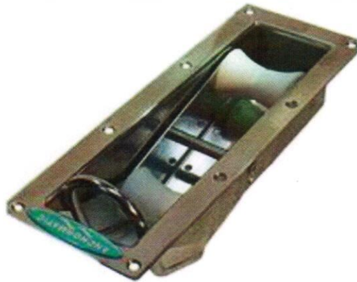
Största yttermått: 425 x 160 mm Yttermått genom badbrygga 100 x 370

Den infällda ankarrullen beställnings nr 802 används mest för inbyggnad i badbryggor där brytvinkeln är större än 130 grader. Vid mindre vinkel rekommenderas den infällda ledade ankarrullen beställnings nr 803.